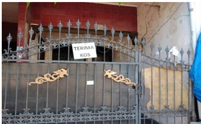
Jl. Balongsari Blok 3A No. 29