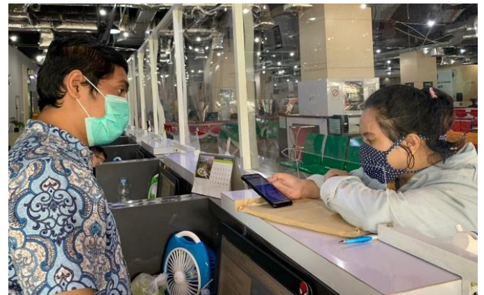
Pelayanan Loker Mandiri

Jumlah Permohonan Perizinan Yang Masuk Sebanyak 129 Berkas