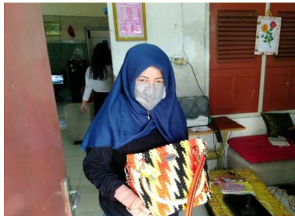
Andila Collection Jl. Teluk Semangka No. 68