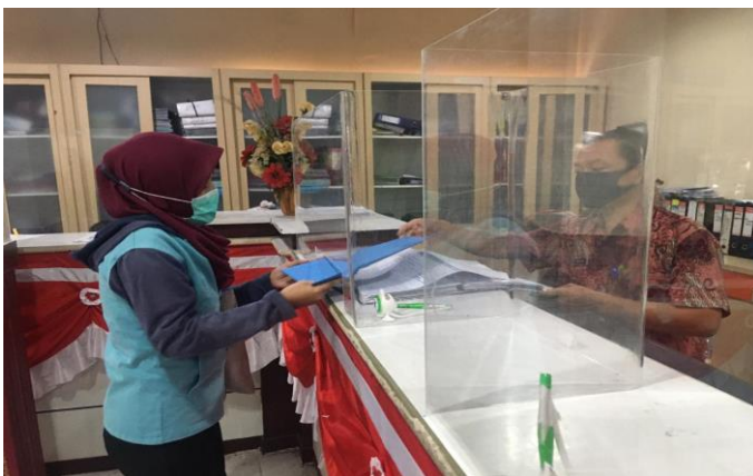
Pelayanan Loker Pengambilan