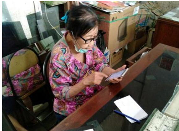
Toko Rukun Jl. Kembang Jepun No. 83