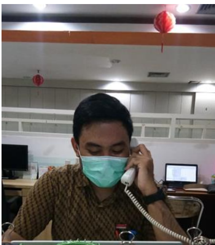
PT Classic Automotive Manutac