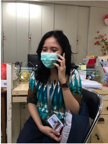
PT Indopenta Bumi Permai