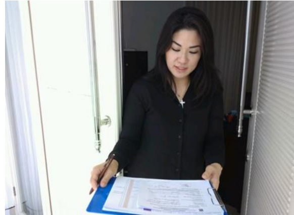
PT Berkat Melimpah Sepanjang Masa Villa Bukit Regency 3 Blok PE 15 No. 15