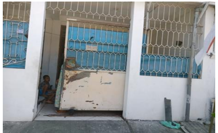
Jl. Balongsari Blok 3A No. 24