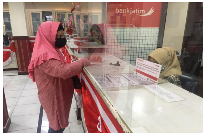
Pelayanan Loker Loker Bank Jatim

Jumlah Permohonan Perizinan Yang Masuk Sebanyak 82 Berkas