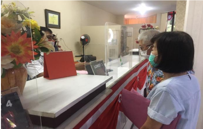
Pelayanan Loker Customer Service