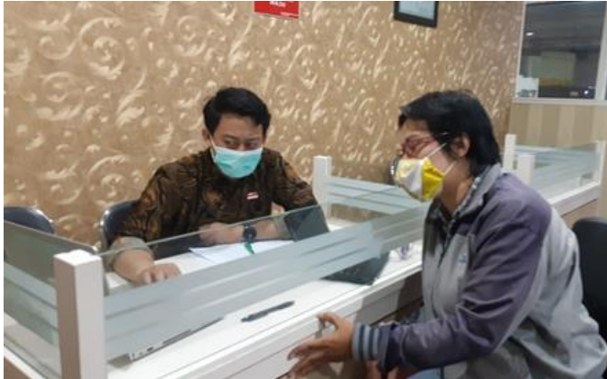
PT Binasekawan Jayaraya