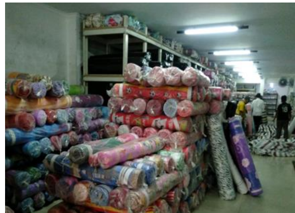
Sion Jl. Slompretan No. 29