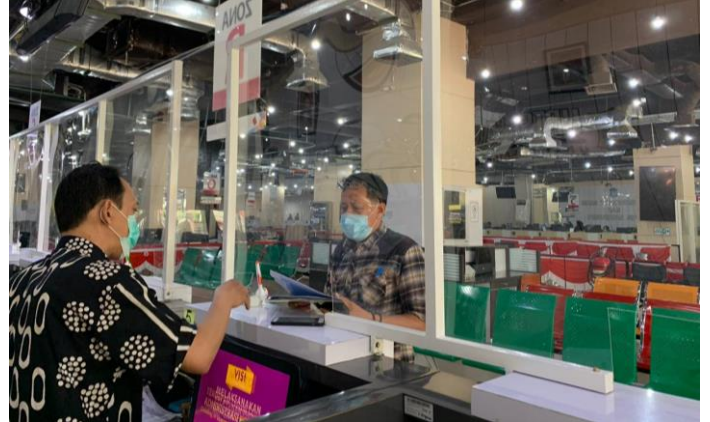
Pelayanan Loker Pengambilan