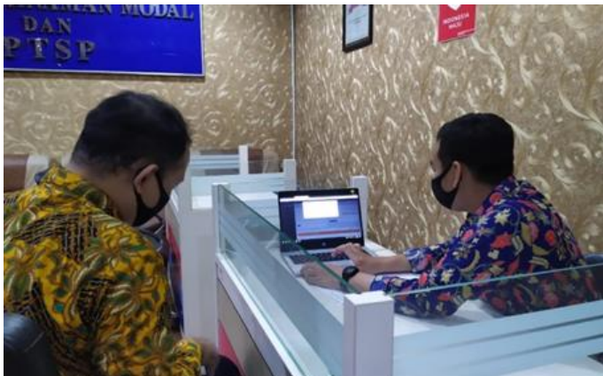
PT Sukses Maju Abadi