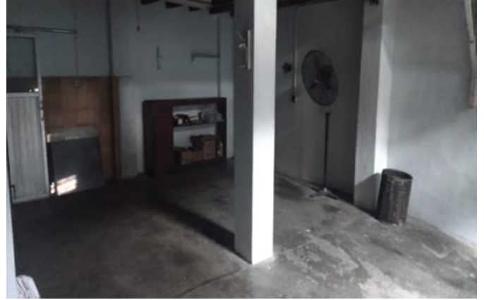
PT SURABAYA PROTHESE ORTHOPEDI MEDIKA Jl. Karang Menur 2 No 8