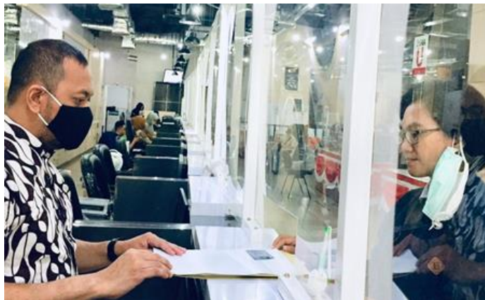
Pelayanan Loker Customer Services