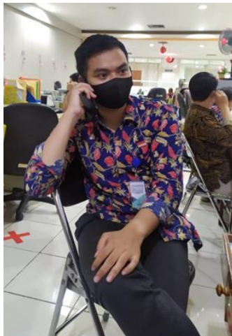
CV Citra Mandiri

Jumlah Perusahaan yang Diberikan Asistensi Online Sebanyak 5 Perusahaan