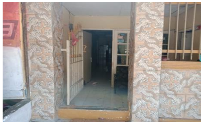
Jl. Balongsari Blok 3A No. 31