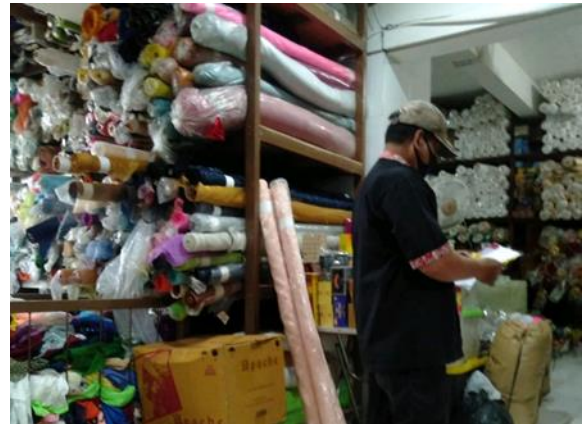
UD Ki Jaya Jl. Slompretan No. 110