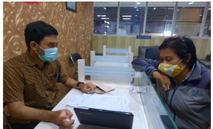
PT Sekawan Manunggal Jaya

Jumlah Perusahaan yang Diberikan Asistensi Sebanyak 4 Perusahaan