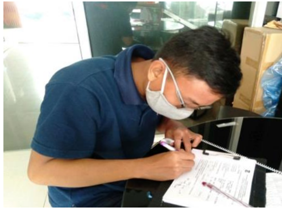
PT Makmur Abadi Sentosa Jl. Semarang No. 134 A