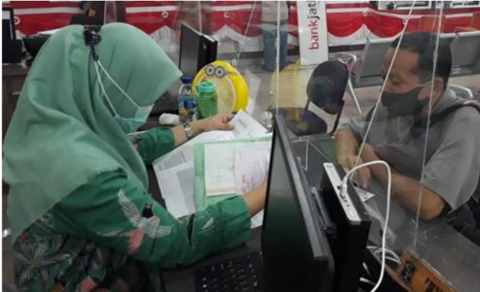
Pelayanan Loker Informasi