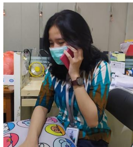
PT Sapta Permata