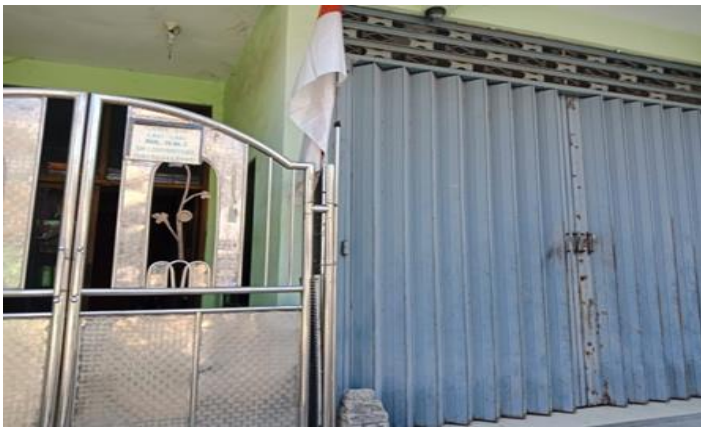
Jl. Balongsari Blok III A No. 23