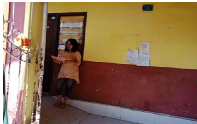
Jl. Balongsari Blok 3A No. 15