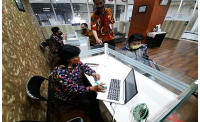
PT Aneka Boga Utama Raya