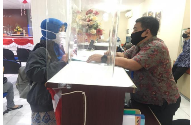
Pelayanan Konsultasi Dinas Kesehatan